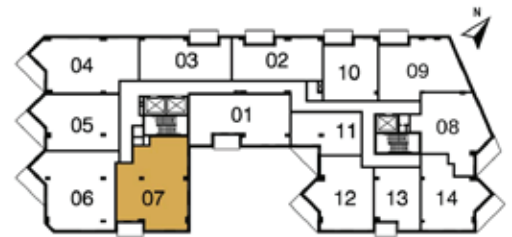
PLAN CLEF du 9 e @ 11 e étage