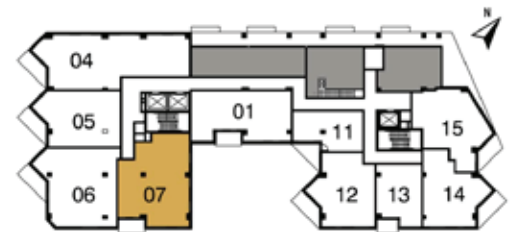
PLAN CLEF 2 e étage

307, 407, 507, 607 ET 707 (1 173 P11) 207, 307, 407, 507, 607, 707, 807, 907 1007, 1107