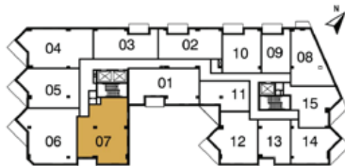
PLAN CLEF du 3 e @ 8 e étage