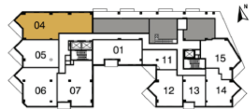
PLAN CLEF 2 e ÉTAGE